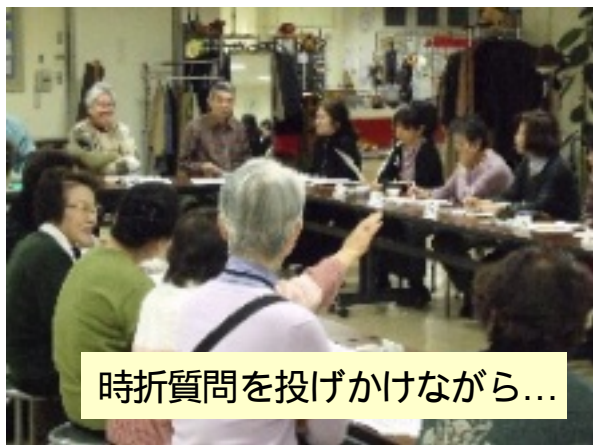
時折質問を投げかけながら...

体の高齢化による集団回収の手の足りなさらしく、今までは通常月一だった回収を週一にする事によって解決できるという講師の話にそれぞれ頷かれていました。 持ち去り業者の話では、東京都の持ち去り被害総額が15億にもなる（平成22年度東り協会調べ）と聞いて憤りを隠せないようでした。 勉強会が終わった後も講師は囲まれて質問を投げかけられていました。講師も皆さんの抱える疑問や不安を少しでも取り除ければ、と帰り道で嬉しそうに話していました。 「勉強会」という形は