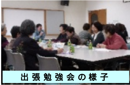
出張勉強会の様子

テーマとしては「資源持ち去り問題」「知って得する集団回収」「リサイクルって何?」などで、町会団体やロイヤル、商店街の方と立場が違つと抱える問題も大きく違つています。皆様に合わせてテーマで行います、お気軽にご相談ください。