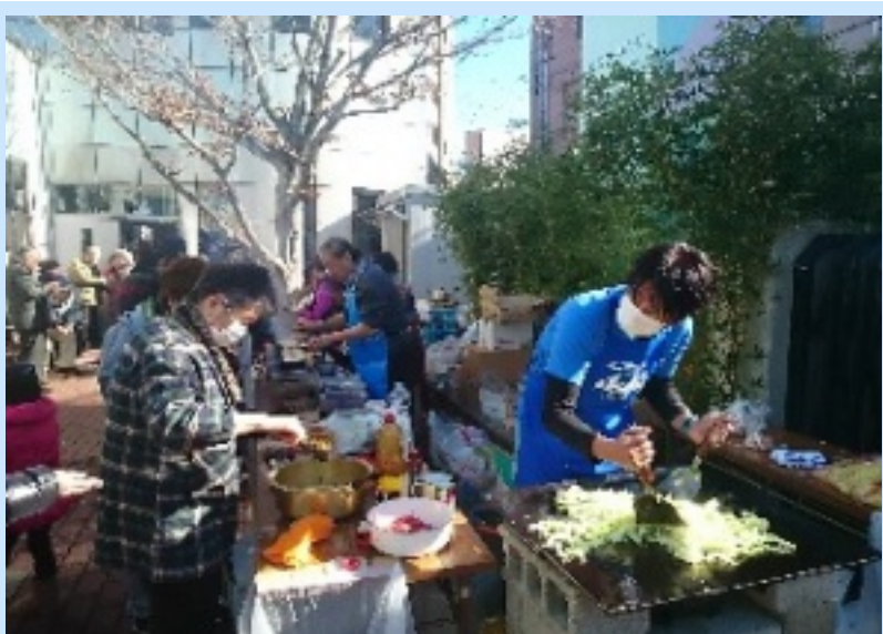
大盛況だった焼きそば